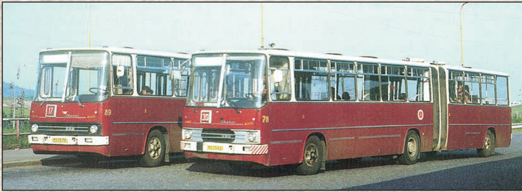
Gluboké autobusy Ikarus č. 78 a 89 na terminálu u nového nádraží v Mostě.

1933 provozovala společnost linku z Mostu do Dolního a Horního Jiřetína označenou jako linku č. 4 a linku č. 5, která řešila chybějící spojení mezi Horním Jiřetínem, Zálužím a Horním Litvínovem. Nejdelsí byla linka č. 6, která jezdila od nádraží v Horním Jiřetíně na Horu Sv. Kateřiny, Brandov a končila u celnice v osadě Zelený důl. Některé spoje pokračovaly až do saského Olbernhau. Tato síť se udržela až do roku 1939. Pro zajímavost uvádíme, že v Zeleném dole byla firma Lange a syn na zpracování mědi a jejích slitin, kterou v roce 1934 koupila Zbrojovka v Brně a zavedla výrobu nábojek.