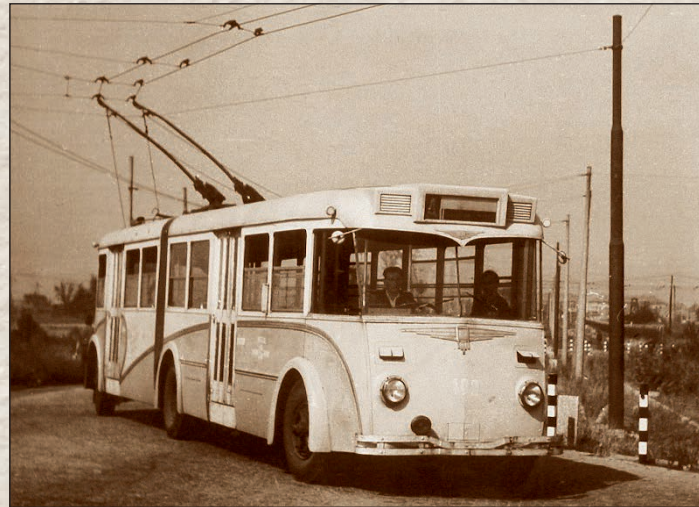
Již zaniklá trolejbusová doprava na Mostecku.

1933 provozovala společnost linku z Mostu do Dolního a Horního Jiřetína označenou jako linku č. 4 a linku č. 5, která řešila chybějící spojení mezi Horním Jiřetínem, Zálužím a Horním Litvínovem. Nejdelsí byla linka č. 6, která jezdila od nádraží v Horním Jiřetíně na Horu Sv. Kateřiny, Brandov a končila u celnice v osadě Zelený důl. Některé spoje pokračovaly až do saského Olbernhau. Tato síť se udržela až do roku 1939. Pro zajímavost uvádíme, že v Zeleném dole byla firma Lange a syn na zpracování mědi a jejích slitin, kterou v roce 1934 koupila Zbrojovka v Brně a zavedla výrobu nábojek.