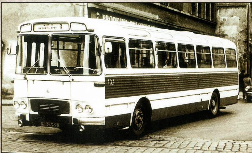
Vůz č. 104 na lince č. 3 na křižovatce s rychlodráhou za spořitelnou v Mostě.

dopravě, neboť konečná zastávka v Janově byla už tenkrát východiskem pro turistické výlety po jižních svazích Krušných hor.