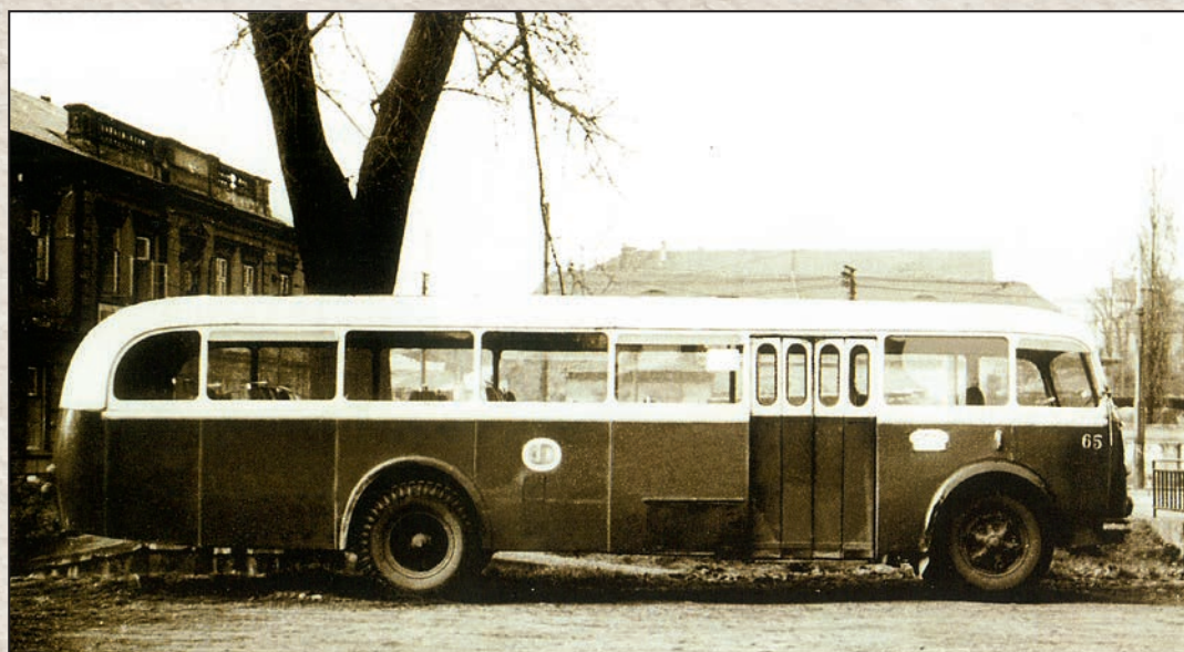
Jeden z nejstarších autobusů série RO č. 65.

elektrické pouliční dráhy do Horního Litvínova, Hamru a Janova. Slavnostní zahájení provozu pak na trati Most, nádraží ÚTD, Kopisty, Růžodol, Horní Litvínov, Chudeřín, Hamr, Janov bylo uskutečněno 7. srpna roku 1901, kdy na trať vyjely čtyři vozy ověncené girlandami. Slavnosti se zúčastnili městská a okresní reprezentace a hosté z Prahy, Vídně a Drážďan, kteří po slavnostních projevech dopoledne projeli celou trať až do Janova. Odpoledne byl již zahájen normální provoz s cestujícími a malodráha tak vstoupila do každodenního života obyvatel okresu. Trať byla dlouhá 12,9 km a vzhledem ke stálému vzestupu přepravy osob musely být posléze dokoupeny a nasazeny na trať ještě další dva vozy. O nedělich a svátcích sloužila i rekreační