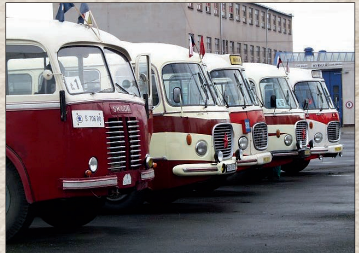
Jeden z nejstarších autobusů série RO č. 65.

Vzhledem k tomu, že historie 110 let MHD je značně rozsáhlá co do hloubky a významnosti, pokusili jsme se na malém prostoru slovem a obrazy uvést alespoň střípky jejího počátku jako připomenutí a vzpomínku, při které si většinou člověk uvědomí mnoho věcí, které se již dnes zdají samozřejmostí každodenního života.